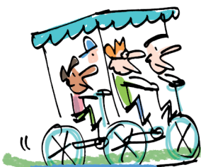
8h25: déplacement en voiture à pédales