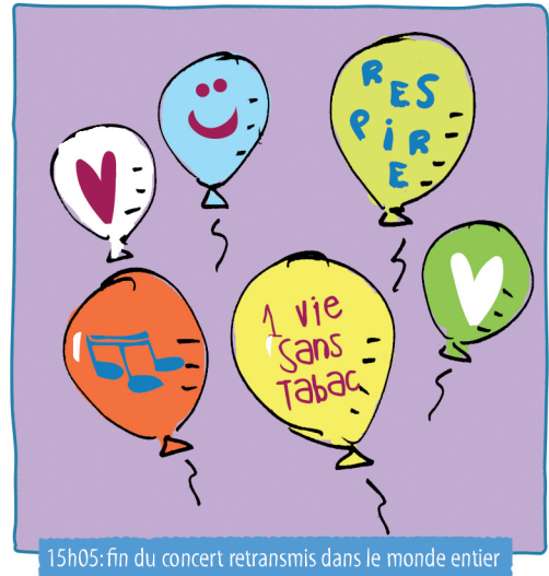
15h05: fin du concert retransmis dans le monde entier