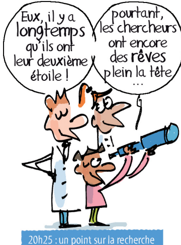
20h25 : un point sur la recherche