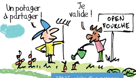
10h15: visite d'un potager bio, collectif et gratuit