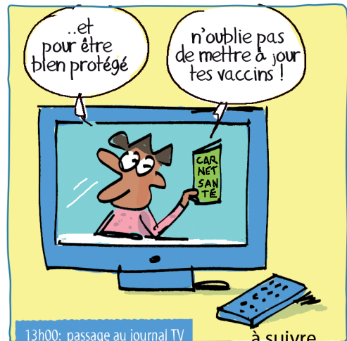
13h00: passage au journal TV