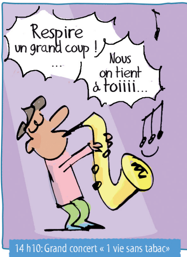
14 h10: Grand concert « 1 vie sans tabac »