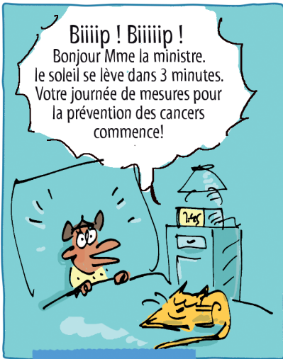
7 h45: réveil de la ministre