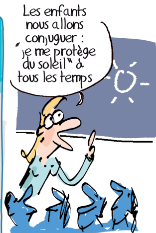
...où l'on profite du soleil, sans se brûler !