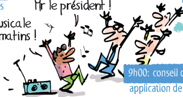
9h00: conseil des ministres application de la loi Zumba

Plus haut les bras Mr le président ! Gym musicale tous les matins !