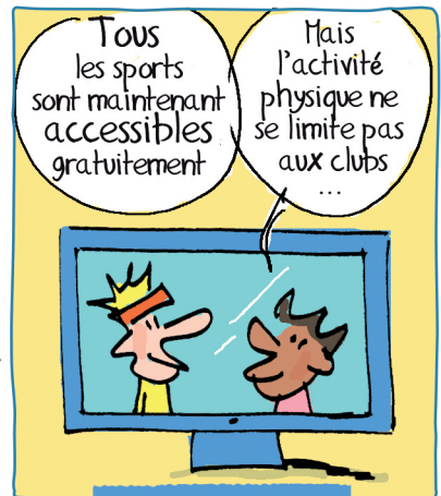
16h35 : Passage sur TV sports