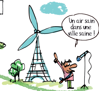
10h45: Conférence sur la qualité de l'air

Plus haut les bras Mr le président ! Gym musicale tous les matins !