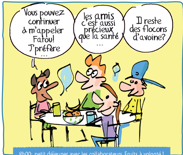
8h00: petit déjeuner avec les collaborateurs. Fruits à volonté !