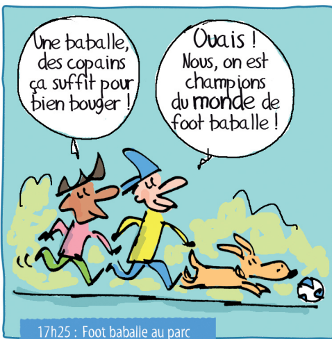
17h25 : Foot baballe au parc