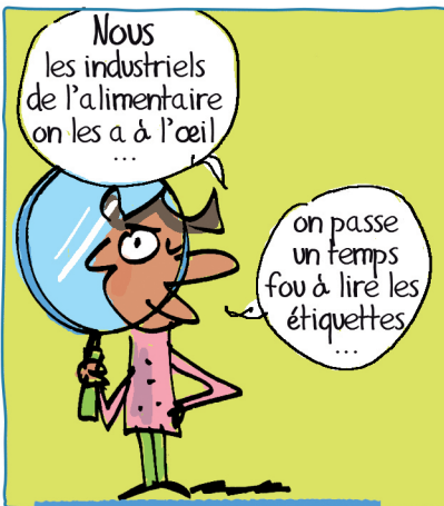
15 h20 : code de la route des produits